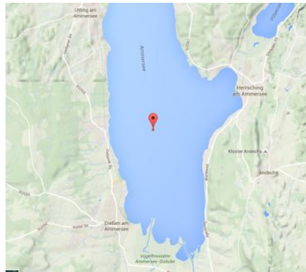
Abbildung 2: Lage der Bojen

Ziellinie: Die Ziellinie ist die Startlinie und ist von der Seemitte kommend, in Richtung „Andechs“ zu überqueren.