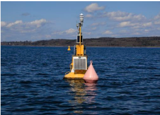
Abbildung 1: Blick Richtung Ostufer

Kurs: Die zu rundenden Tonnen sind querab des Dampfersteges von Riederau in Richtung Seemitte auf Position 47°58'56"N, 011°7'22.5"E. Beide zu rundenden Bojen bleiben an Backbord. Da es sich um Messbojen 1 handelt, bitte entsprechenden Abstand halten.